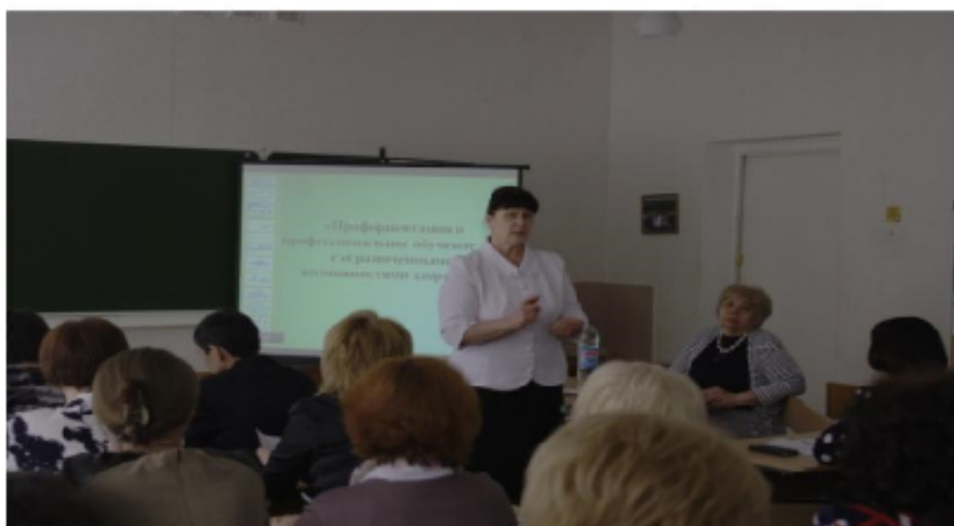
Обучающий семинар для преподавателей «Подготовка студентов педагогических специальностей к обучению детей с ОВЗ»