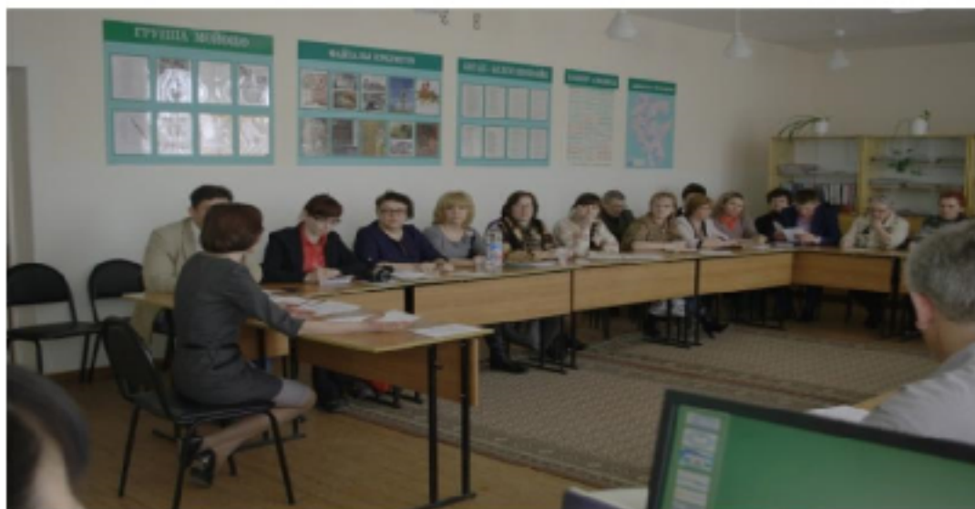
Стажировка преподавателей колледжей Республики Башкортостан по вопросам организации инклюзивного профессионального образования